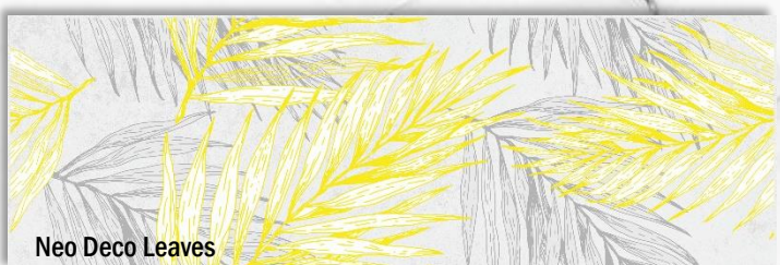
Neo Deco Leaves