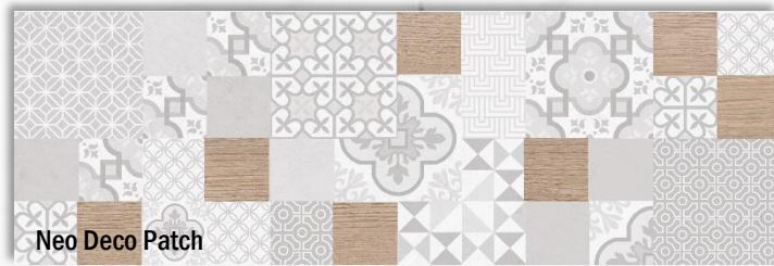
Neo Deco Patch