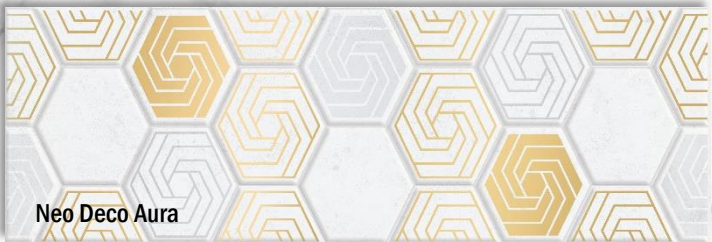
Neo Deco Aura