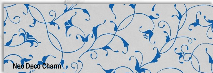
Neo Deco Charm