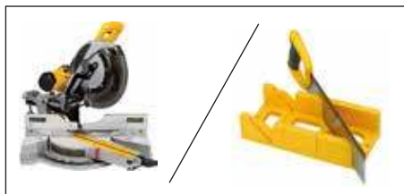
торцовочная пила / ножовка с мелким зубом и стусло*