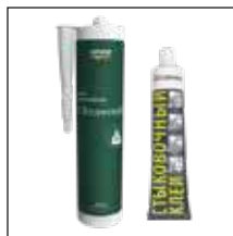
монтажный и стыковочный клей UltraWood