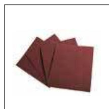
мелкозернистая шлифовальная бумага